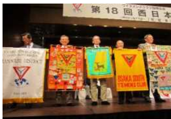
第18回西日本区大会