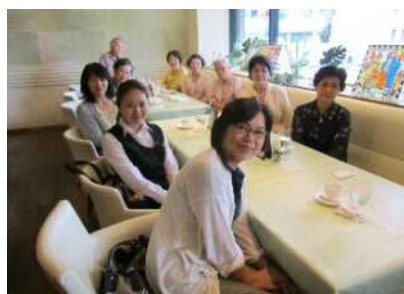
メネット引継ぎと慰労会