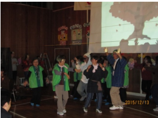
YMC Aリーダー・スタッフ・ワイズメン みんなでジョイフルクリスマス！

テレビで一瞬見た一級建築士のドクターコパによるラッキーカラーの番組を見て以来、続けている。彼の祖父・父親は風水士で、育った彼は、言われて本を書くことになる。その手の幸運カラーで、家の扉をぬりあげ、幸運を呼び寄せ、東京在住の人々が、その色を確かめる為に車で見に来る程、吉運を呼んでいる。又、彼は奈良の大神神社（奈良最古の神社）に必ずお参りに来るとの事、影響を受けて私も訪ねる事（新年に）にしている。おかげ様で、行く先々で「大吉」をひかせてもらっている。自分の前に並ぶ人が、ラッキーカラーを身に付けている人を選んで次へ並んだ。当然だった。こちらにも選ぶ権利があるようだ。ドクター小林祥晃氏は、書物を出版し（親にすすめられて）大当たりしている。家相風水や色風水、金運風水など様々な本を出している。私なりに応用して、これに細木数子さんの六星占術（統計学に基づく）を組み合わせ（95%当たっている）利用している。皆さん、是非試してみてください。十年来私は凶をひいたことはありません。いつも大吉が（大半）、吉をひいています。試してみてください。良い年でありますように。祈る。