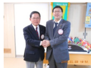
林阪和部長と市本メン