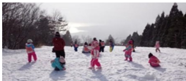
奈良Y M C A雪ん子キャンプ

また、2月24日から全国のY M C Aではいじめをなくす運動として「ピンクシャツデー」を展開しております。奈良Y M C Aでも、いじめのない社会を目指して、会員の皆さんからお寄せいただいたいじめをなくすメッセージを掲示するなど理解の輪を広めたり、スタッフがピンクのTシャツを着てキャンペーンを盛り上げております。