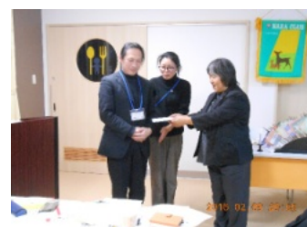
磯崎様ワインのお話有難うございました