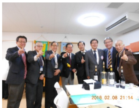
市本メンを囲んで 正野区書記、小野EMC事業主任、 望月EMC事業主査、林阪和部長、 高井メン、市本メン、中井メン、 寺岡メン