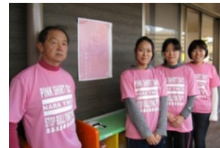
全国のYMCAではいじめをなくす運動として「ピンクシャツデー」を展開中