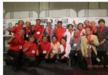
第19回西日本区大会 奈良クラブ集合写真