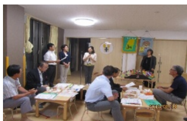
6月例会 会場「あきしの保育園」 園児のかわいい机と椅子をお借りました

せっかく与えられたワイズメンズクラブで過ごす時間、様々なボランティア活動に関わり自分自身が「感謝」と「祈り」の生活に少しでも近づきたい機会としよう！と考えています。来年の今頃は「感謝の言葉が無さ過ぎる！」という配偶者からのクレームが激減してる予定です。