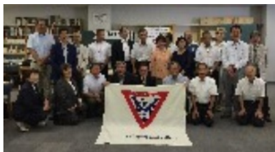
第4回阪和部評議会