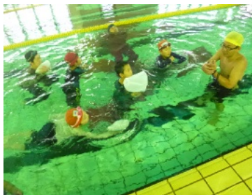
『命を守るうキャンペーン』

それぞれに関わるスタッフの健康が神様に守られ、導かれ、良い働きができますことを祈りつつ、日々業務に従事しております。