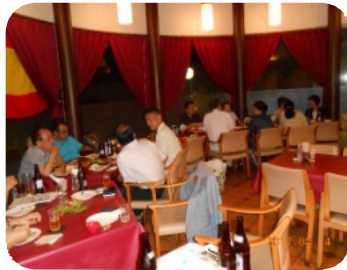
納涼例会会場の様子