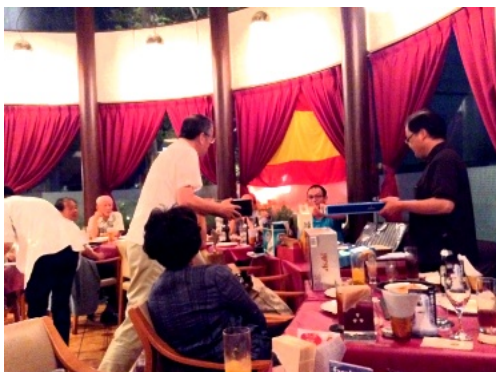
8月納涼例会@ピカピカ

それと、この世（顕界）とあの世（幽界）は相通じていて、ひとつにつながっています。顕界（けんかい）は、現に私たちの生きる世界なので「現生界」ともよばれ、幽界は、亡くなると赴く霊の世界なので「霊界」ともよばれています。つまり、現生界で自身が苦しいのは、霊界のご先祖様が苦しんでいるのです。反対に、ご先祖様が幸せなら、現生界で生きている自身が幸せなのです。ご先祖様の供養は、大切です。