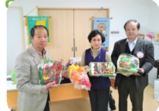
あきしの保育園児へ野菜セットプレゼント