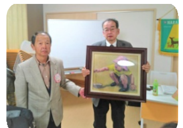
御殿場クラブ 長田ウィメンから保育園児へプレゼント