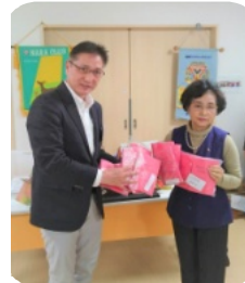
YMCA障がい児、者クラスへX'masカードプレゼント