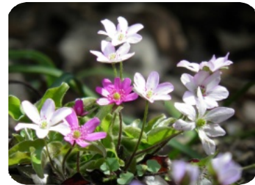
ミズミツナ 三角草（雪割草）