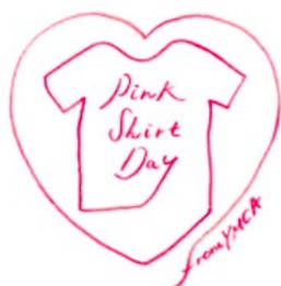
「ピンクシャツデイ」

また、2月28日からは「ピンクシャツデイ」に取り組みます。奈良YMCAでも、ピンクシャツデイの取り組みとして、会員の皆さんからいじめに対するの想いを動画でメッセージをいただいて、フェイスブックにアップしていきます。また、スタッフは昨年同様に、ピンク色の物を着用してキャンペーンに取り組みます。『いじめ』について考え、公平で平和な世界の実現を目指す為に、私達は第一歩を踏み出します。