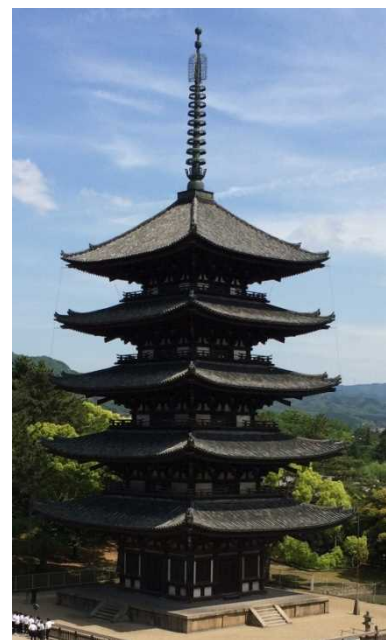
興福寺五重の塔

「ともに歩もう。前へ」 “Let's go together. GO GO” 副題「阪和部は一つ」